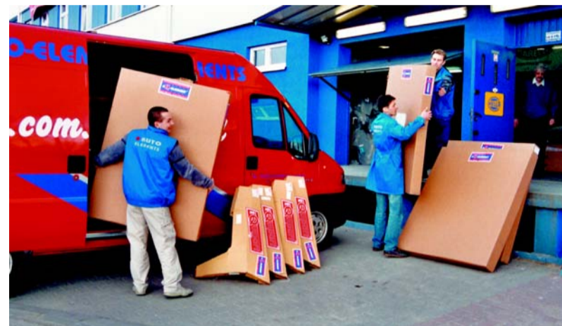
zdjęcie nr 2

A-E: Po pierwsze serwisowe oryginały - dostarczamy je do kilkunastu marek aut,